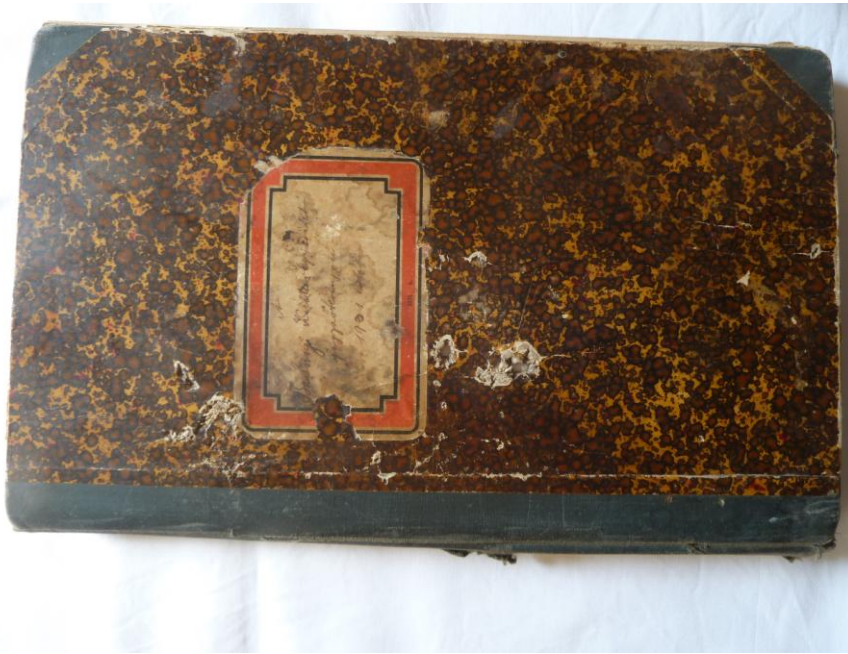
A Bakony Egyesület jegyzőkönyveit tartalmazó könyv