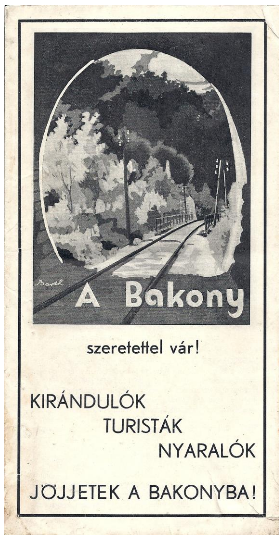
Az egyesület egyik prospektusának címlapja