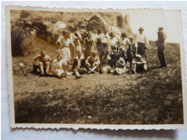
Cseszneki kirándulás 1932 július 16.