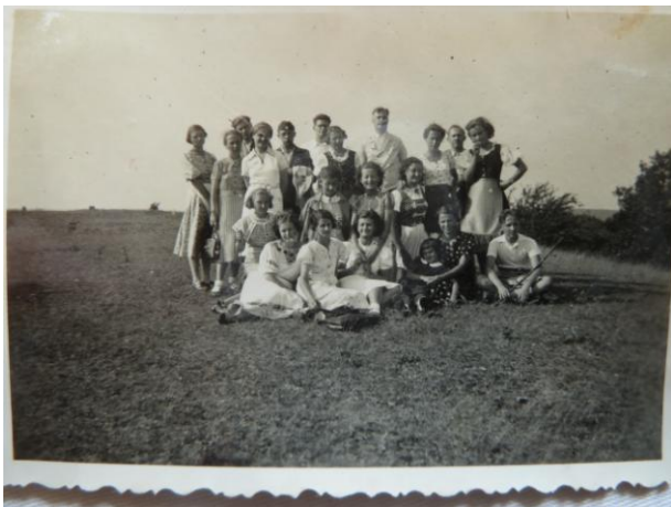
Kardosréti kirándulás 1938 július 23.