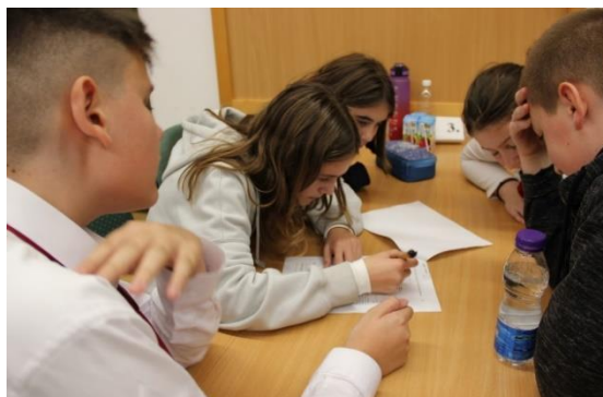
Elméleti és gyakorlati feladatok egyaránt vártak a résztvevőkre

A versenyre öt csapat nevezett, a Zirci Reguly Antal Német Nemzetiségi Nyelvoktató Általános Iskola, a Borzavár-Porvai Német Nemzetiségi Nyelvoktató Általános Iskola, a Veszprémvarsányi Fekete István Általános Iskola és AMI, a Gyulaffy László Német Nemzetiségi Nyelvoktató Általános Iskola és a Litéri Református Általános Iskola mérte össze tudását. A vetélkedő résztvevőit, a diákokat és az őket kísérő felkészítő tanárokat dr. Kutasi