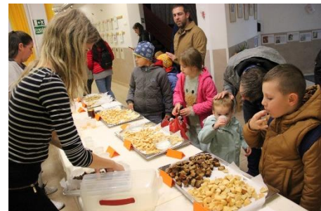
A szervezők nem győzték kiszolgálni a vendégeket a kóstolón – mindenkinek jutott a sok finomságból

A szervezők törekedtek arra, hogy ízletes, egyúttal egészséges legyen a kínálat. Ennek megfelelően csalános palacsinta csipkebogyó lekvárral, grissini fokhagymás és káposztamártogatással, ánizsos keksz, áfonyás banánkenyér, citromos-mákos kamillás keksz, gyömbéres keksz is várta az érkezőket, a falatok mellé homoktövis limonádét, húsító jeges csipkebogyó teát és nyugtató gyermekeát lehetett kortyolgatni.