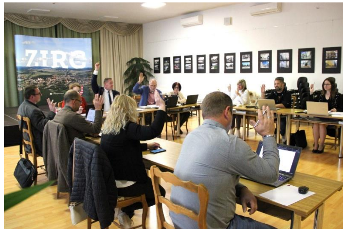
A képviselő-testület több rendeletét is módosította, illetve felülvizsgálta a munkaterv szerinti ülésén

A közterületek használatára vonatkozó szabályozást illetően új rendelet megalkotása mellett kötelezték el magukat a döntéshozók,