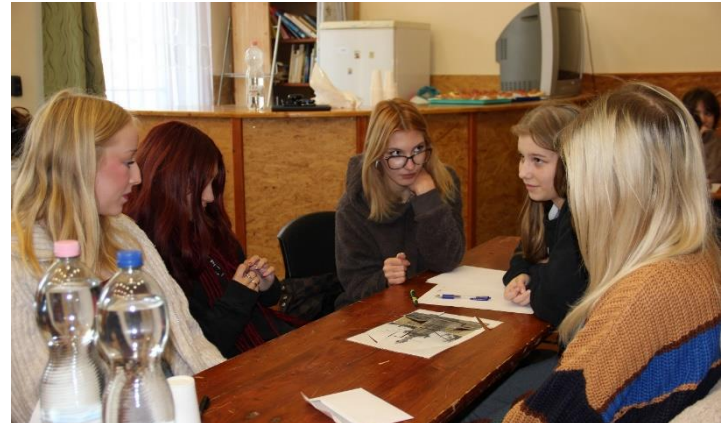
A puzzle már kész, de mit tudhatunk a rajta látható nevezetességről? – tanakodik a bélások egyik csapata

A ZIRC40 vetélkedőt a Zirci Reguly Antal Német Nemzetiségi Nyelvoktató Általános Iskola „Reguly-Sokk” csapata nyerte ( Kovács Szilvás