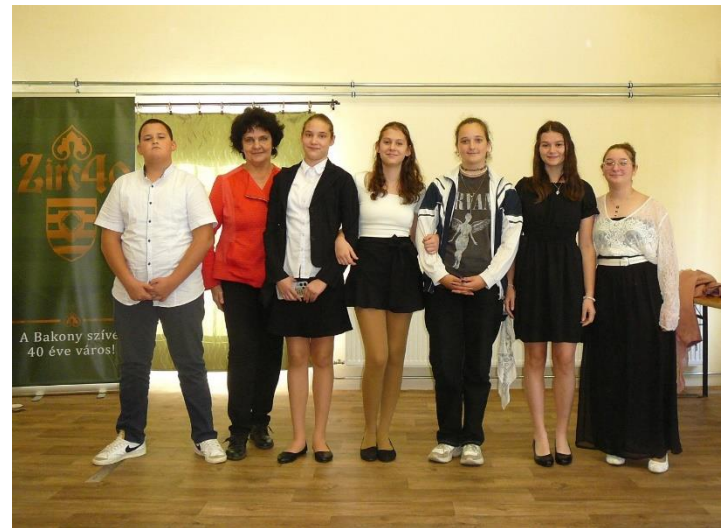
A győztes „Reguly-Sokk” csapata felkészítő tanárával

Az eredményhirdetésen valamennyi csapatot, felkészítő tanáraikat és a zsűri tagjait is oklevéllel, valamint ZIRC40 logóval ellátott ajándéktárgyakkal jutalmazták meg a szervezők.