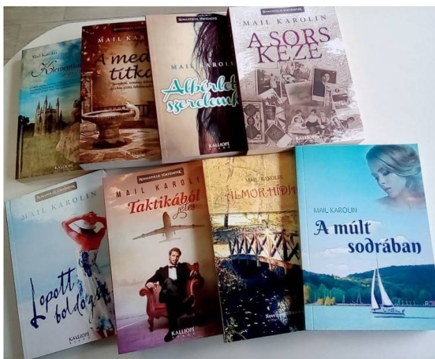
A zirci írónőnek eddig nyolc kötete jelent meg, ezek közül a legnépszerűbb az első, „A medál titka” című regény volt

– Hiszem, minden embernek van írva legalább egy könyv, amit el kell olvasnia. Egy dolog van vele, meg kell találnia azt. Tehát csak ajánlani tudom mindenkinek, olvasson sokat!