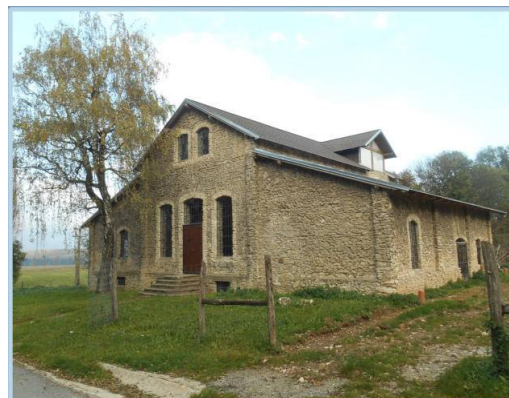
Szeszgyár épült 1911-ben

A felsőtündéri egyesített iskola és kápolna távlati képe