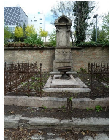
Walla Géza és a Chmell család kriptája a Fiumei (Kerepesi) úti temetőben