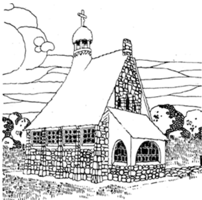
148. ábra. A felsőtündéri egyesített iskola és kápolna távlati képe.

A felsőtündéri egyesített iskola és kápolna távlati képe