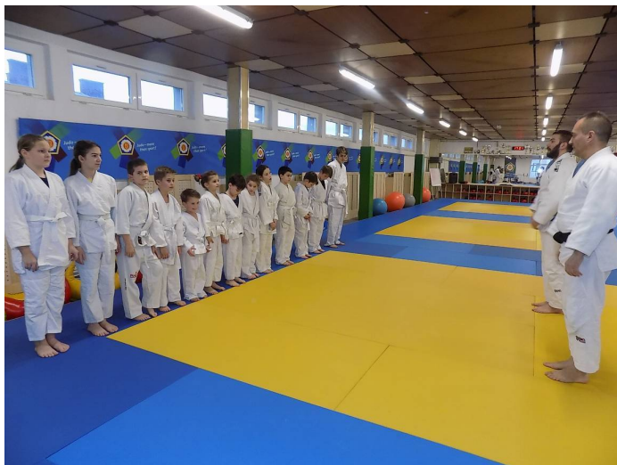
Ők a legifjabb generáció, bár betegség miatt erről az edzésről többen hiányoztak