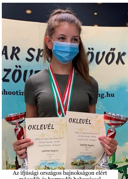
Az ifjúsági országos bajnokságon elért második és harmadik helyezéssel