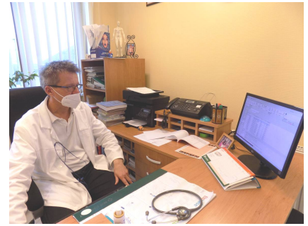
A háziorvosok eljárásrend alapján határozzák meg, hogy mikor kötelező a mintavétel

Hozzátette, a légúti tüneteket mutató betegek a háziorvosi rendelőkbe továbbra sem jöhetnek be, őket telefonos konzultáció útján látják el tanácsokkal, illetve segítik őket abban, hogy mitévők legyenek. A többi beteget természetesen behívják, ha szükségesnek látják az orvosi vizsgálatot, de őket is csak korlátozott számban. A gyógyszerfelírás, leletek megbeszélése továbbra is telefonon történik. – Mindez nagyon sok