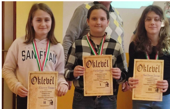
A légpuskás serdülő lányok versenyében mindhárom helyezett a zirci lövészklubból került ki