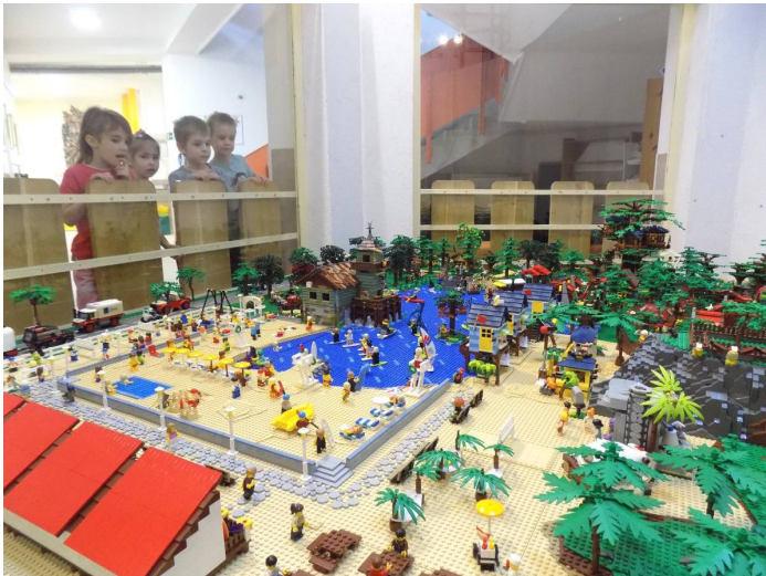
A gyerekeket újra és újra elbűvöli a LEGO-kiállítás látványa