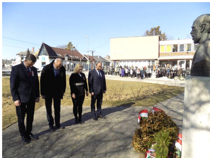
Zirc Városi Önkormányzat képviselőtének és térségünk országgyűlési képviselőjének közös főhajtása a koszorúzást követően

Az ünnepi megemlékezés főhajtással vette kezdetét történelmi nagyjaink Március 15. téri emlékhelyén. Zirc Városi Önkormányzat, a Veszprém Megyei Kormányhivatal Zirci Járási Hivatala, Zirc Város Diszpolgárainak képvisellete, a Zirci Rendőrőrs, a Zirci Önkormányzati Tűzoltóság, a Zirci Római Katolikus Egyházközség, a Ciszterci Apátság, a Zirci Református Egyházközség, a Zirci Evangélikus Egyházközség, a Zirci Országzászló Alapítvány, a Zirci Széchenyi Kör és a FIDESZ-KDNP Zirci Szervezete helyezte el az emlékezés koszorúit.