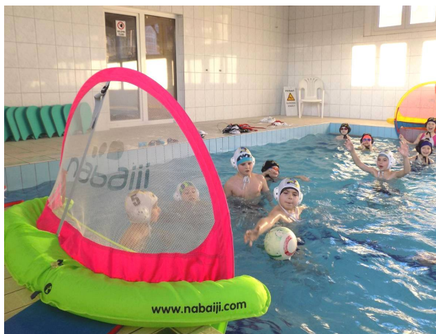
Remek hangulatú mérkőzés zárta az edzést a zirci Tanuszodában

Az alapos propagandamunkát követően február első hetében indultak be a vízilabda-edzések Zircen, kezdetben csak egy-egy óras foglalkozásokat tartottak, de aztán rövid időn belül kétórásra kellett bővíteniük a programot, hiszen a létszám folyamatosan növekszik, lemorzsolódásról pedig szerencsére nem lehet beszélni. Aszakember mindent