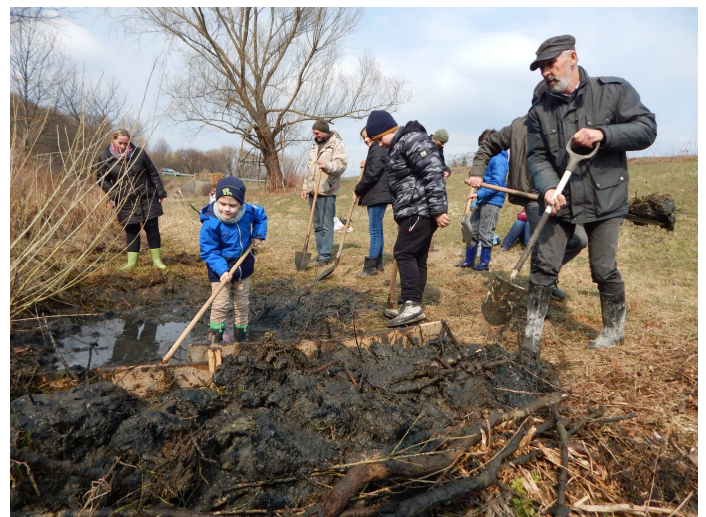
Közös munkával készül a békabölcső Zirc határában

Láthatóan mindenki jól érezte magát és reméljük, hogy a békák hamarosan birtokba veszik a számukra kialakított tófelületeket.