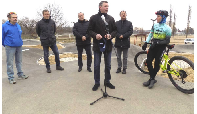
Ottó Péter polgármester nyitotta meg az ünnepélyes átadó rendezvényét

Programok sokaságát indították el, az egyik legsikeresebb a Bringapark Programjuk, melynek keretében két év alatt már több mint száz pálya megépüléséhez nyújtottak támogatást. Bizalmát fejezte ki, hogy ez a pumpapálya hozzájárulhat a zirciek aktív életmódjához.