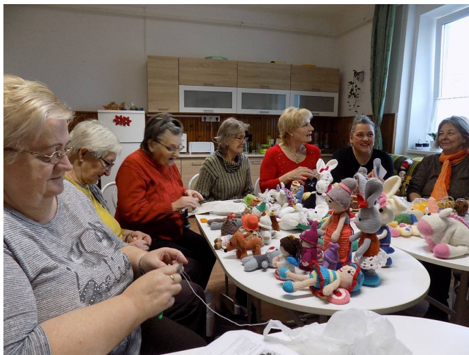
A klubtagok az eddig elkészült alkotásokat is elhozták a kedvüknéért