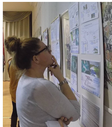
Az előadás alkalmára tablók is bemutatásra kerültek az összegyűjtött dokumentumokból

Hosszas előkészületek, leltározások, névjegyzék-készítések, az 1941. évi népszámlálás és összeírás adatainak teljesen szabálytalan alapulvételével a Belügyminisztérium erre a célra felállított osztályai és az Állami Földhivatal oldotta meg a nagy történelmi feladatot. A kegyetlen döntés azokra vonatkozott elsődlegesen, akik az említett összeíráson német nemzetiségűnek, német anyanyelvűnek vallották magukat, akik a Volksbund (magyarországi német kisebbségek szervezete) tagjai voltak, akik német katonai alakulatba kerültek besorozásra, és akik a korábban magyarosított nevüket visszanevetesítették. Ezen listából azokat mentesítették, akik fontos nemzetgazdasági ágazatban dolgoztak és nélkülözhetetlen kisiparosok voltak, valamint a csak német anyanyelvűeket tíz kataszteri hold föld és egy lakás korlátozásával. Az előadás foglalkozott a kitelepítettek helyére Felvidékről áttelepített magyarok történetével és a zirci kitelepítés körüli emlékezésekkel is.