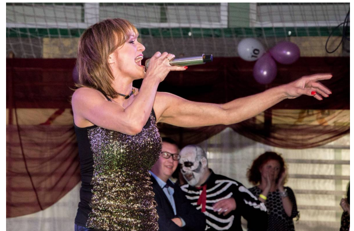
Sztárként Szandi lépett fel a jubileumi rendezvény színpadán

Az est sztárvendége SZANDI művésznő volt, aki amellet, hogy fokozta az együttes által megalapozott remek hangulatot, közvetlenségével, barátságos jellemével is elismerést váltott ki. Több régi nagy slágere felcsendült és legújabb számát is elhozta a zirci közönségnek a már harmincéves aktív pályafutást maga mögött tudó, a magyar popzenei életbe tinédzserként befutó énekesnő.