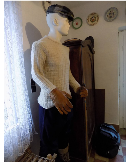
A régi idők sí-viseletkultúrája egy próbababán kerül bemutatásra...