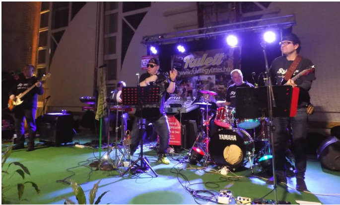
A Rulett együttes remek hangulatot teremtett a bálon

A hangulatfelelős a zirci kötődésekkel rendelkező Rulett zenekar volt, amely nevéhez méltón többféle műfajban „pörgette meg” a vendégsereget. Az együttest hazánk egyik legfelkapottabb bulizenekaraként tartják számon, és már nem először léptek fel a Zirci Farsangoló Bálon, többek között az első városi farsangon is ők szolgáltatták a muzsikát. Repertoárjukban az elmúlt évek és a régmúlt idők nagy slágerei egyaránt felhangzottak.