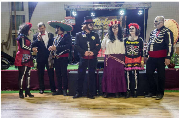
A „Los Muertos” fantáziánévű csapat lett a jelmezverseny győztese

A jelmezesek felvonulása nagy sikert aratott, volt, aki egy kis előadással is kedveskedett a közönségnek. „Michael Jackson” például egy Magna Cum Laude-slágeret énekelt, és tényleg popkirálynak érezte magát, mert kérte, hogy emelkedjenek a kezek a magasba. Horrorisztikus jelenetek is tarkították a show-t, „Los Muertos” néven a mexikói halottak napi maskarázást idéző csapat vonult fel húrokat is pengetve, Drakula gróf az erdélyi fejedelemasszony nyakába harapott, és nem kisebb félelmet keltett, amikor csárdásruhás hölgyeik kíséretében a magyar huszárok kivonták kardjukat. A tizes szám bűvöletében 2020 második hónapjának első napján az 1920-as évek hangulatát idézték a Charleston-lányok, és színpadra lépett egy fegyveres kokainbáró is.