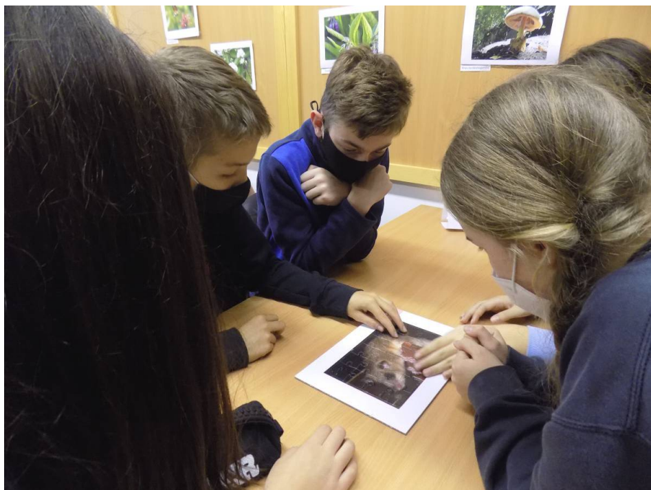
Egy puzzle-t is ki kellett rakniuk a csapatoknak, a képen a harmadik helyezett zirciek