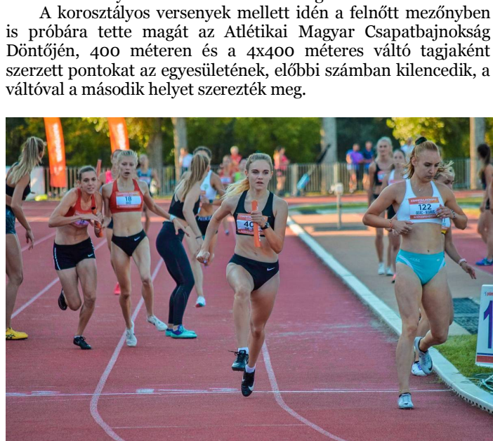
Tizenöt évesen a felnőtt mezőnyben is bemutatkozott, a váltóval második helyen végeztek a Csapatbajnokságon

A korosztályos versenyek mellett idén a felnőtt mezőnyben is próbára tette magát az Atlétikai Magyar Csapatbajnokság Döntőjén, 400 méteren és a 4x400 méteres váltó tagjaként szerzett pontokat az egyesületének, előbbi számban kilencedik, a váltóval a második helyet szerezték meg.