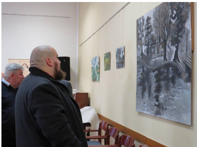
Érdeklődve nézte a közönség az alkotásokat a kiállítás-megnyitón

A tárlat év végéig tekinthető meg a közönség számára.