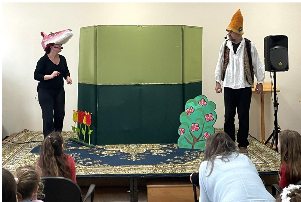
A Mesélő Börönd Társulat mesejátéka a könyvtárban igazi kikapcsolódás volt családok számára

Mesebeli útjára a klubteremben szép számmal összesereglett gyermekek kísérték el, akik mindenről megfeleledkezve, a mesejátékba önfelédten bekapcsolódva, végig lelkesen segítették Kiskondást, aki kiállva a próbatételeket, végül elnyerte a szépséges