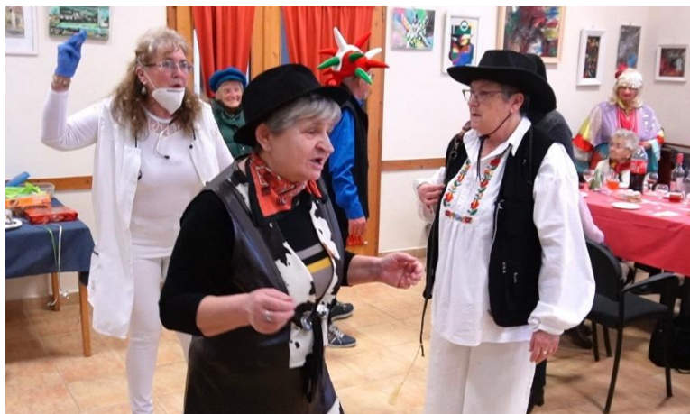
A városi könyvtár megújult épülete egyre több klubfoglalkozásnak ad teret. Fenti képünkön a Zirc Városi Nyugdíjas Klub és a Diabétesz Klub közös farsangi mulatsága

Kollégáinkkal arra törekszünk, hogy mindenki megtalálhatja a számára érdekes, izgalmas tevékenységet – ha éppen nincs ilyen, akkor támogatjuk Önöket abban, hogy elindulhasson új ötletük. Éppen ezért, ha szeretnék tereinket használni, közösségi ötleteik vannak, vagy csak keresik a találkozási helyet, ahol rendszeresen beszélgetnének, keressenek bennünket telefonon, személyesen vagy e-mailen a mottónk jegyében – a közösségért vagyunk, a közösséget szolgáljuk.