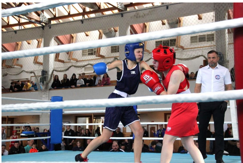
Küzdelmes mérkőzéseket láthattunk a versenyen, melyen több korcsoportban mérték össze tudásukat az ökölvívók

ezzel a mérkőzéssel hazavihették a verseny „LEGJOBB FELNŐTT FÉRFI MÉRKŐZÉSE” különdíjat.