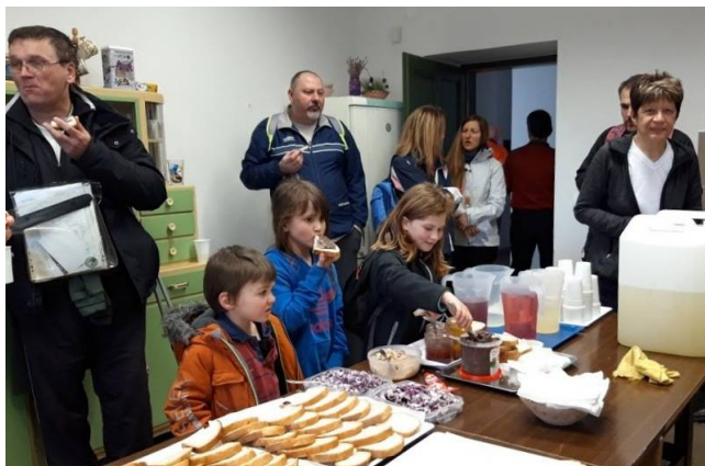
A túra legfiatalabb résztvevői a 22 km-es távon indultak

ez azóta is így van. Szerencsére, évek óta ismét a Reguly Antal Múzeum és Népi Kézműves Alkotóház ad helyet a túra bonyolításának, erősítve és tudatosítva ezzel Zirc nagy szülőföldjének ismertségét, akinek az idei évben ünnepeljük születésének 200. évfordulóját. Lehet, hogy ez is közrejátszott a rekordszámú túrázó jelentkezésében? Nem tudjuk. Hiszen nagyon sokan évek óta visszajárnak, de nagyon sokan voltak azok is, akik