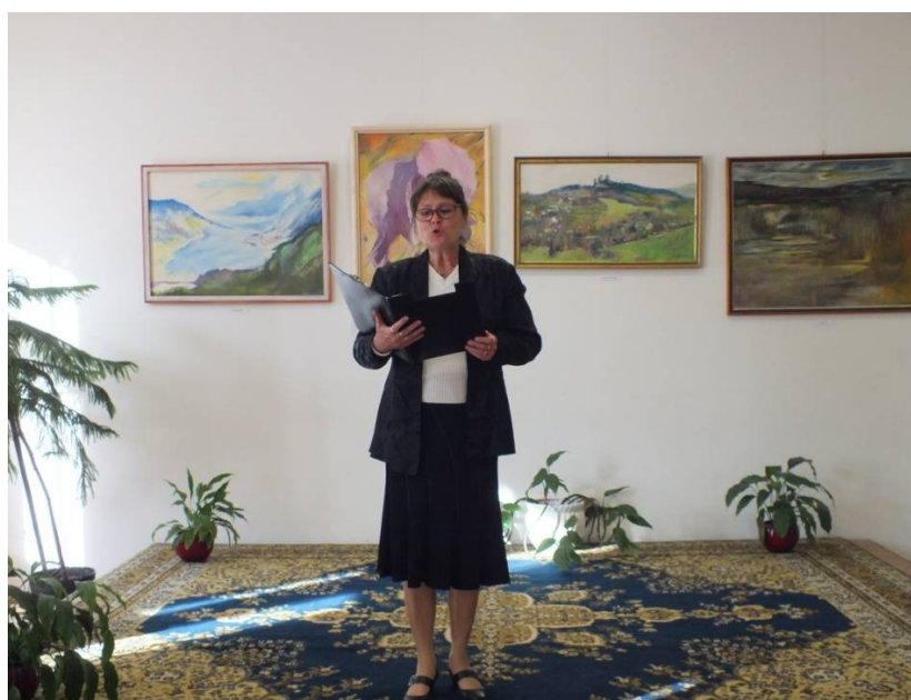
A rendezvény bevezetéseként egy József Attila verseiből összeállított idézetcsokrot hallhattak a jelenlévők.