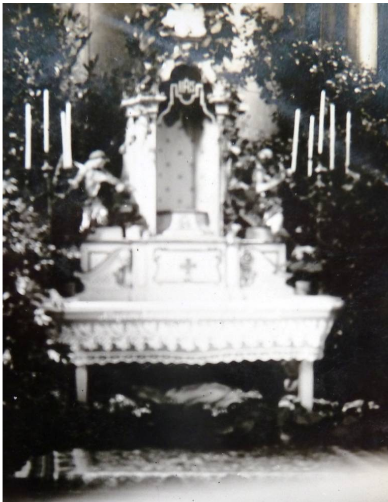
Szentsír az apátsági templomban 1932. húsvét