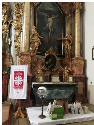
Ulrich Józsefné

A rászoruló családok és a karitás nevében is hálánkat és köszönetünket fejezzük ki minden adományozónak!