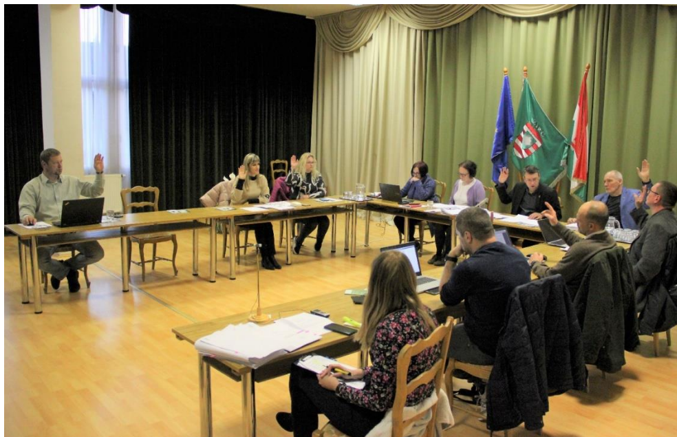
Éppen a Víz Világnapján hozott a képviselő-testület a víziközművel kapcsolatos döntéseket

Az önkormányzat által fenntartott kulturális intézményekkel kapcsolatban személyi döntések meghozatalára is sor került. A képviselő-testület korábban pályázatot írt ki a Békefi Antal Városi Könyvtár, Művelődési Ház és Stúdió KB