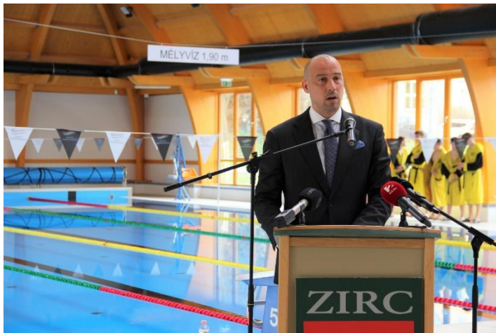
Dr. Schmidt Ádám sportért felelős államtitkár ünnepi beszéde

Azt kívánta, hogy gyerekek és felnőttek egyaránt leljék örömeiket az új létesítmény kiváló szolgáltatásaiban és minél többünknek váljon élete részévé a rendszeres testmozgás. „Az új magyar sportirányítás számára kiemelten fontos, hogy sportnemzetből sportolónemzetté váljunk” – hangsúlyozta az államtitkár.