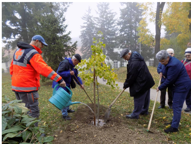
A nyugdíjasok a kórház munkatársának közreműködésével ültették el a fát

Mint azt megtudhattuk, később egy emléktábla is készülni fog a növény mellé, ami az utókor számára is jelzi majd, hogy a klubtagok milyen szándékkal ültették a fát egy őszi délutánon.