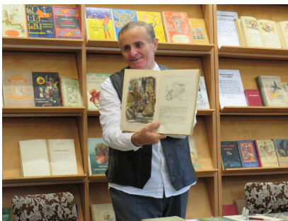
A Könyvtári Napok keretében nyílt kiállítás Téglás Miklós mesekönyv-gyűjteményéből

A Békefi Antal Városi Könyvtár az idei évben is csatlakozott az Országos Könyvtári Napokhoz, melyet 2006-tól rendeznek meg.