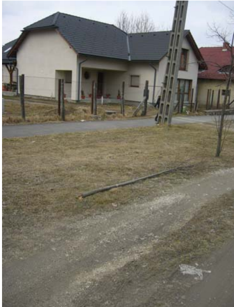
Kossuth utca, a 20-as kilométerkőnél

(A dokumentálást követően ezt természetesen megtettem és a sörös dobozt az Alkotmány utcai kockaházak előtt található szelektív hulladékgyűjtőbe vittem. Megköszönte, és azt mondta, itt sokkal otthonosabban érzi magát...)