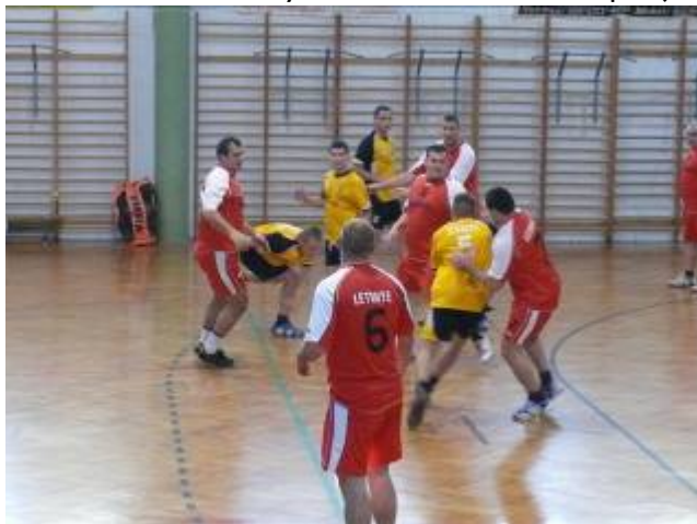
Nagy küzdelem folyt a pályán, nem volt könnyű dolguk a fiatal zircieknek a rutinos Letenye ellen

A bajnokságba később bekapcsolódó, s így versenyen kívül induló Letenye elleni mérkőzésre is hazai pályán került volna sor a sorsolás szerint, de a rossz időjárás miatt Alsóörsre vitték a találkozót. A Zirc KSE több hiánnyal utazott a Balaton partjára, két beállósát és két átlövőjét is kénytelen volt