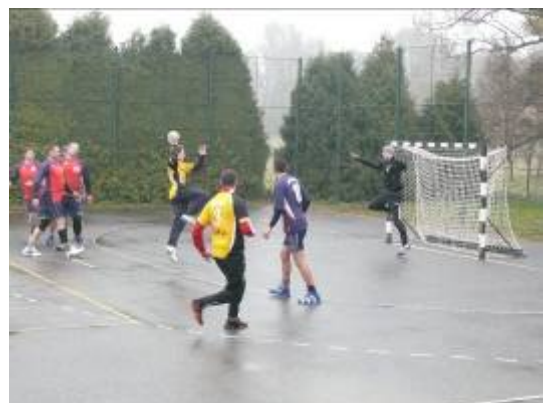
Zirci ziccer