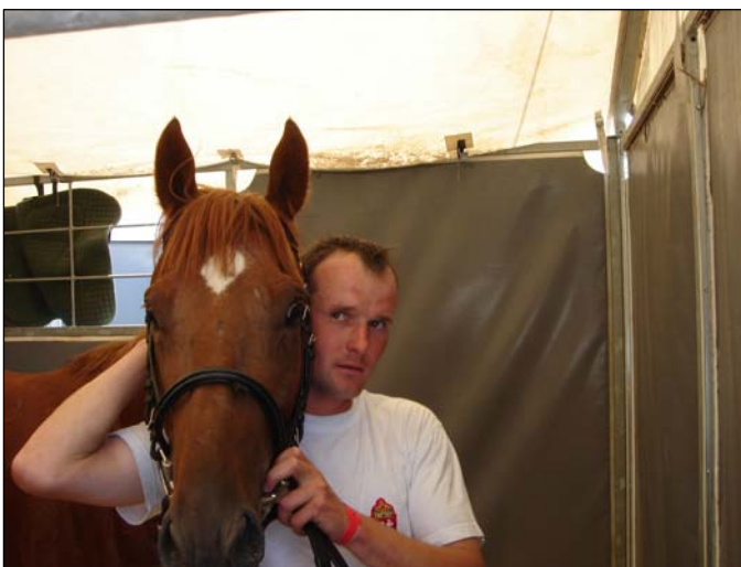
A nyerő páros és a nyerevényük

Az első kanyart követően az élre állt, s rajt-cél győzelmet aratott.