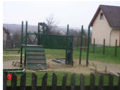
Van, amikor jó szándékkal ostromolnak egy várat. Ez már nem játék...

Bármikor folytatódhat a peronemelés. Szeptemberben adtunk hírt arról városunk honlapján, hogy a zirci vasútállomáson megemelik a peronokat, ezáltal könnyebbé válik a fel- és leszállás. Fényképet is tettünk közzé, melyen jól látszik, hogy az ötös és hatos vágány között akkor már el is végezték ezt a munkálatot. Az olvasókban, utasokban felmerülhet a kérdés, hogy miért nincs folytatás. Voltaképpen a már megemelt peronnál sem végeztek teljes értékű munkát, hiszen aszfaltburkolatot még nem kapott. A kettes és hármás vágány között egyáltalán nem történt beavatkozás. November közepén kaptam e-mail-t a Városüzemeltetési Osztály munkatársától, mely szerint a peronok hamarosan elkészülnek. Aztán közbeszólt az időjárás, ezt megelőzően pedig kisebb technikai problémák léptek fel, ezért állt az építés – közölte a helyi vasúti iroda munkatársa, aki hozzátette: várják a munkagépeket, tehát bármikor folytatódhat a peronemelés.