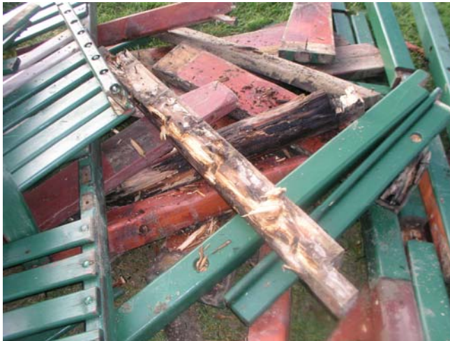
Az idő vasfoga a romba döntött váron