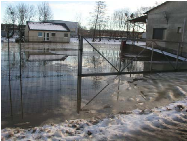
Víz alatt az ipartelep (december 7. reggeli órák)

Megint a víz volt az úr Zircen. A hétfőről keddre virradó éjszaka leesett nagymennyiségű eső és az olvadásnak indult hó együttes hatásának következtében megáradtak a folyók. A Mayer-árok kiöntött, a víz keresztülfolyt az ipartelepen, nehezítve a közlekedési viszonyokat a Park utcában. A meginduló vízfolyam hordalékokat szállított magával, a növényi hulladék a város több árkában is eltömődést eredményezett. Az átereszek kitisztításán dolgoztak az önkormányzat közcélú munkásai. Kivonult a tűzoltóság is, de nem tudtak beavatkozni, mint ahogy munkagépet sem lehetett alkalmazni a kritikus szakaszokon a hozzáférhetetlenség miatt. Pusztá emberi erővel sikerült orvosolni a problémát, a kotrást követően tempót váltott a víz, s lejjebb kúszott néhány centimétert szintje, míg másnapra az apadás méterben volt mérhető. A Cigánydombi ároknál szintén eredményes volt a Városüzemeltetési Osztály által irányított munka, itt nagy hasznát vették a nemrégiben felszerelt hordalékfogó vasrácsoknak.