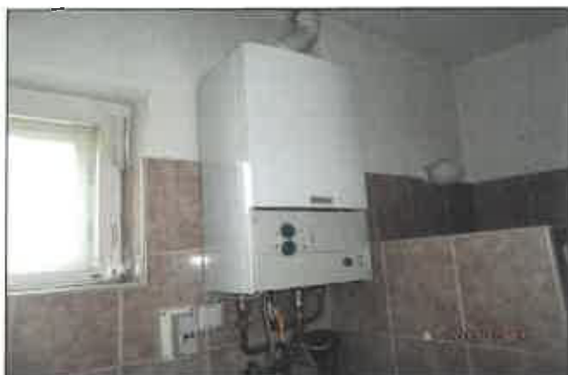
19. Házközponti fűtést biztosító és a melegvizet előállító fal, kombi gázkazán