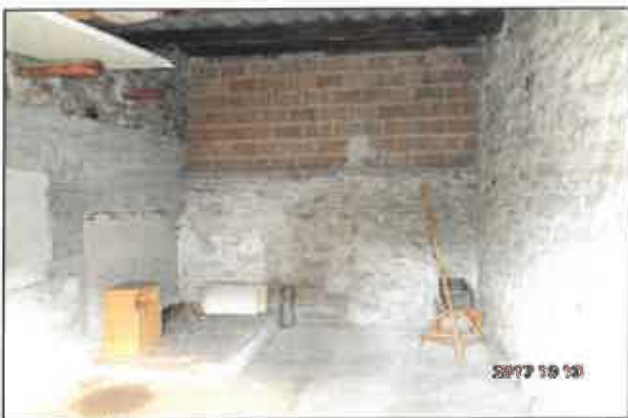
24. Melléképület tároló