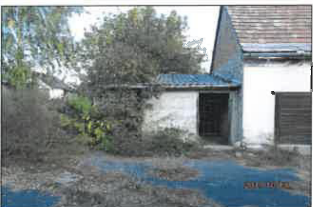
23. Melléképület homlokzata