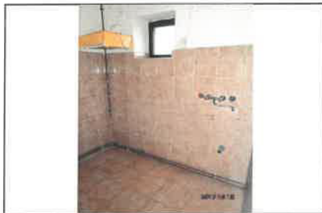
20. Főzőfülke, konyhabútor, gáztűzhely hiányzik