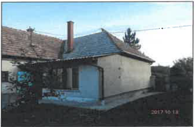
6. D-i, udvar felőli homlokzat