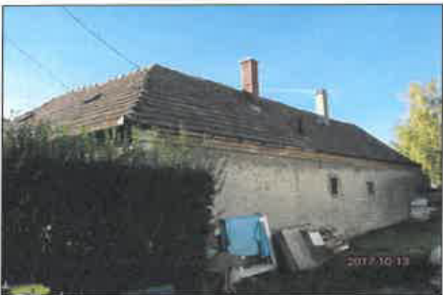
3. É-i, szomszéd felőli homlokzat