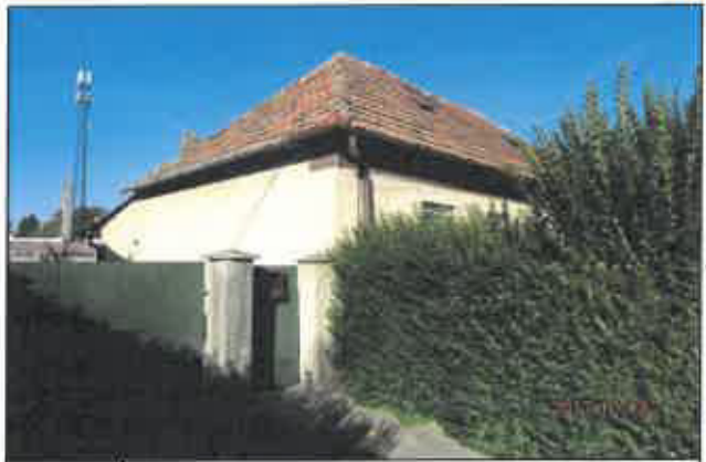
4. Utca és oldalkert felőli homlokzat