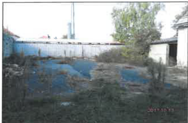
8. Kerített udvar