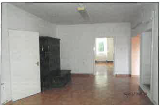
12. Nappal-étkező, kiegészítő cserépkályha fűtés