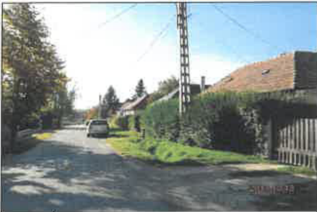
1. Reguly Antal utca, környezet