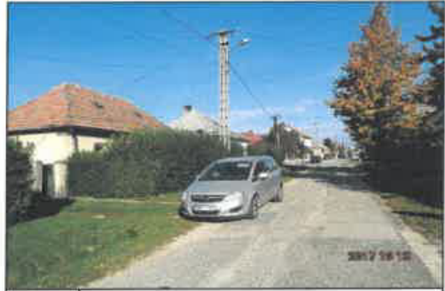
2. Reguly Antal utca, környezet