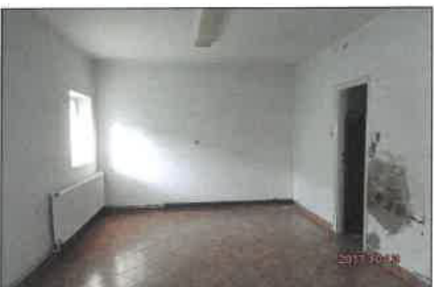
11. Nappal-étkező, csőrepedésből adódó vízesedés