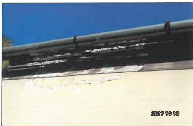
7. Leázási nyomok