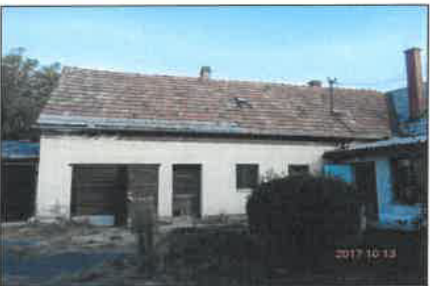
5. D-i, udvar felőli homlokzat